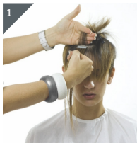
1 Passé abteilen und Quikkie unterlegen.