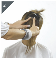
2 Zweites Quikkie als Gegenstück von oben auflegen und andrücken.