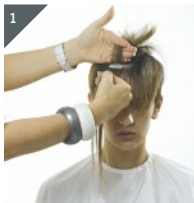
1 Passé abteilen und Quikkie unterlegen.