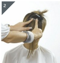
2 Zweites Quikkie als Gegenstück von oben auflegen und andrücken.